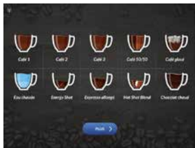
Thème par défaut : bleu